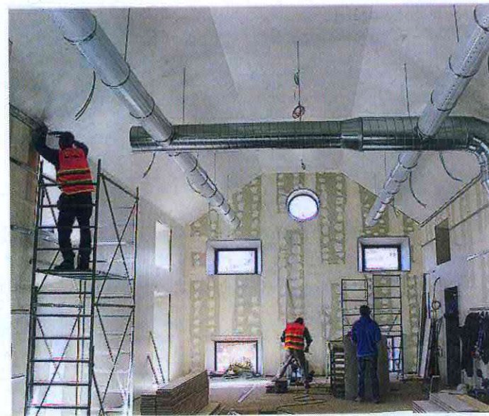
L'EX GRANAIO I lavori di copertura completamente in legno della vecchia struttura: diventerà centro di ricerca per il cibo

La Cascina Triulza, un'antica costruzione rurale era già presente all'interno del sito dell'esposizione universale che aprirà i battenti a maggio. È una delle cascine che segnano il paesaggio nei dintorni di Milano e riportano la città alla sua origine contadina e agricola. Il complesso di Cascina Triulza, esteso su un'area di 7.900 metri quadri, è gestito, in collaborazione con Expo Milano 2015, dalla Fondazione Triulza, un raggruppamento di numerose organizzazioni di rilevanza nazionale e internazionale, selezionate tramite un bando di gara. Oltre a restar come centro dello sviluppo sostenibile e della ricerca tecnologica sull'alimenta-